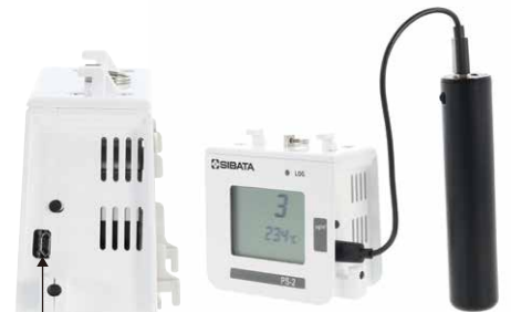
USB インターフェース